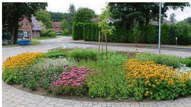
Sichtbares Engagement: Vor der Grundschule in Ströhen wurde ein Kreisfeld mit blühenden Pflanzen bestückt, die einen wichtigen Lebensraum für Insekten bieten.